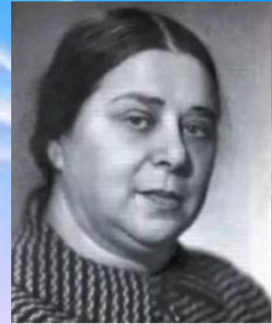
Л. И. Божович

Исследования педагогов и психологов (Л. С. Выготский, А. Н. Леонтьев, С. Л. Рубинштейн, Л. И. Божович и многие другие) направленные на формирование познавательных интересов дошкольника показывают, что продуктивность интеллектуального развития детей в целом зависит от того, как организован процесс обучения, передача им знаний.