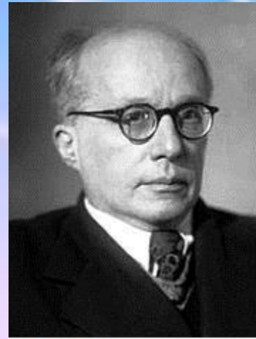
С. Л. Рубинштейн