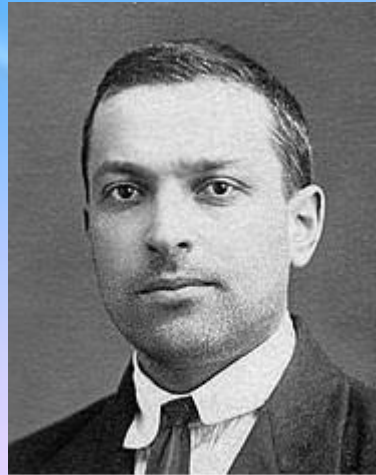
Л. С. Выготский